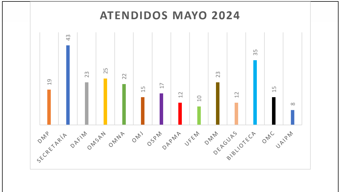
Grafica No. 01